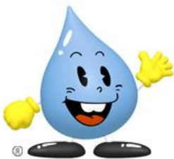
東京都水道局イメージキャラクター「水滴くん」

東京都水道局は2018年度の優良請負工事として、局長表彰対象15件（延べ19者）と施工部所長表彰対象16件（延べ19者）を選定した。このうち局長表彰についてはあす5日に都庁内で式典を開き表彰状を贈る。 優良請負工事の受賞者と対象案件は次の通り。 【局長表彰】新日本工業 中央区日本橋室町三丁目地先から同区日本橋本町三丁目地先間配水本管（800mm）新設工事 ▽ロード建設 八王子市めじろ台四丁目地先から同市めじろ台一丁目地先間配水本管（400mm）新設工事 ▽株本建設 工業 渋谷区松濤二丁目4番地先から同区道玄坂二丁目25番地先間配水小管布設替工事 ▽フジケン 大田区平和島四丁目地先から同区平和島三丁目地先間配水本管（500mm）布設替工事 ▽クボタ工建 中央区八丁堀一丁目地先から同区明石町地先間配水本管（600mm・500mm）布設替及び配水小管布設替工事 ▽東急・日本国土・河本JV 新座市新堀二丁目地先から同市本多一丁目地内間原水連絡管（2000mm）用トンネル築造及びトンネル内配管並びに外1か所原水連絡管（2000mm）トンネル内配管工事 ▽松原企業 八王子市小比企町1048番地先から同市小比企町1138番地先間配水小管布設替及び新設工事 ▽岩波建設 林道一ノ瀬線緊急補修工事 ▽メタウオーター 金町浄水場統合監視制御設備整備工事 ▽コーシ建設 中野区東中野一丁目15番地先から同区東中野一丁目1番地先間配水小管布設替工事 先間配水小管布設替工事 ▽城北興業 世田谷区奥沢三丁目33番地先から同区奥沢二丁目17番地先間配水小管布設替工事 ▽データム 狛江市東野川三丁目4番地先から同市東野川四丁目10番地先間配水小管布設替及び新設工事 ▽小河内建設 小河内貯水池土砂流入防止施設（岫沢）機能回復工事 ▽熊谷・ユナイテッド 二友組JV 東和市清原一丁目地内から同市桜が丘三丁目地先間送水管（2000mm）用トンネル築造及びトンネル内配管工事 ▽日立製作所 上井草給水所外2か所監視制御設備改造工事